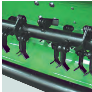
Albero coltelli. Flail shaft.