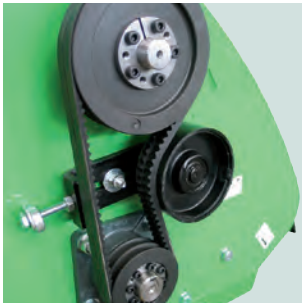
Facile tensione cinghie. Easy belts tightening adjustment.